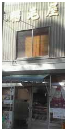
昭和9年創業「精肉屋」