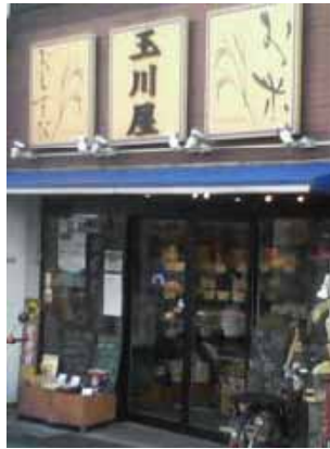
朝6時から営業「米屋」