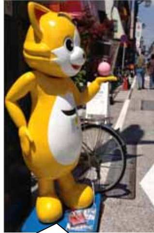
ぎんちゃんが、お出迎え