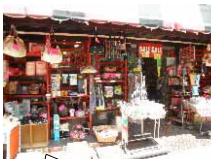
個性的な生活雑貨店