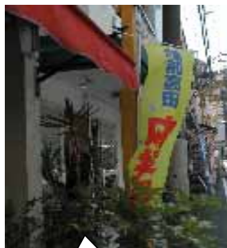
陸前高田の 復興支援