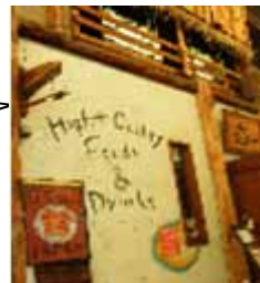
アットホームな 感じの家具店