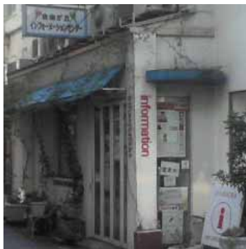
インフォメーション センター