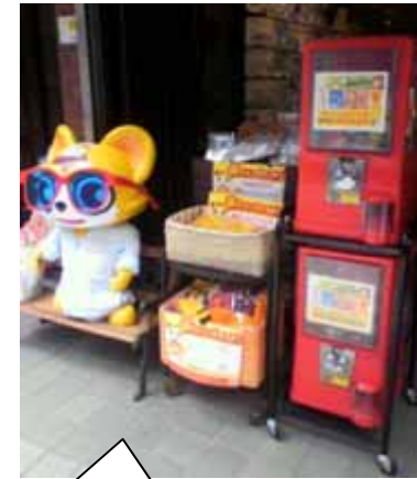
ぎんちゃんブランドガチャガチャ