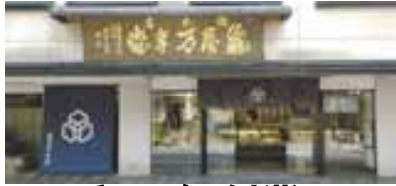
昭和13年創業の 御菓子処