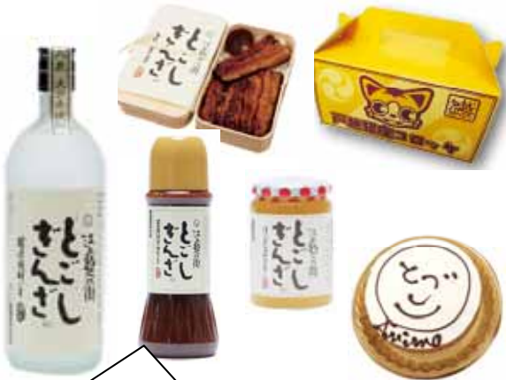
オリジナルブランドは、なんと、30種類も!?