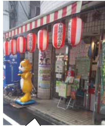
イベントの抽選会、当たるかな～！