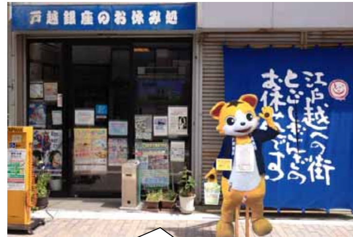
お休み処で、ひと休憩・・・