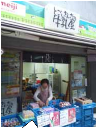
戸越オリジナルのお酒も扱う、牛乳屋さん