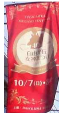
自由が丘女神まつり のフラッグ