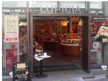
カフェ・ケーキのお店