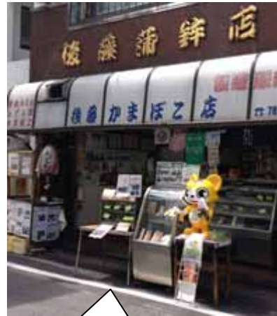
戸越銀座コロケは、いかが～！